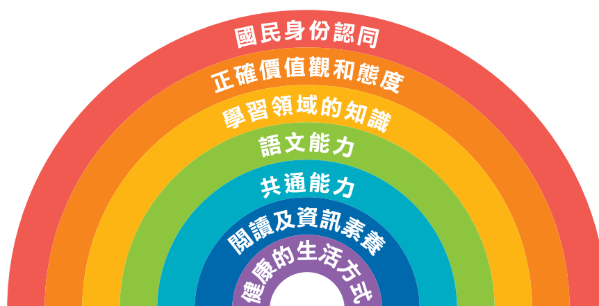
圖 1.2 小學教育更新的七個學習宗旨