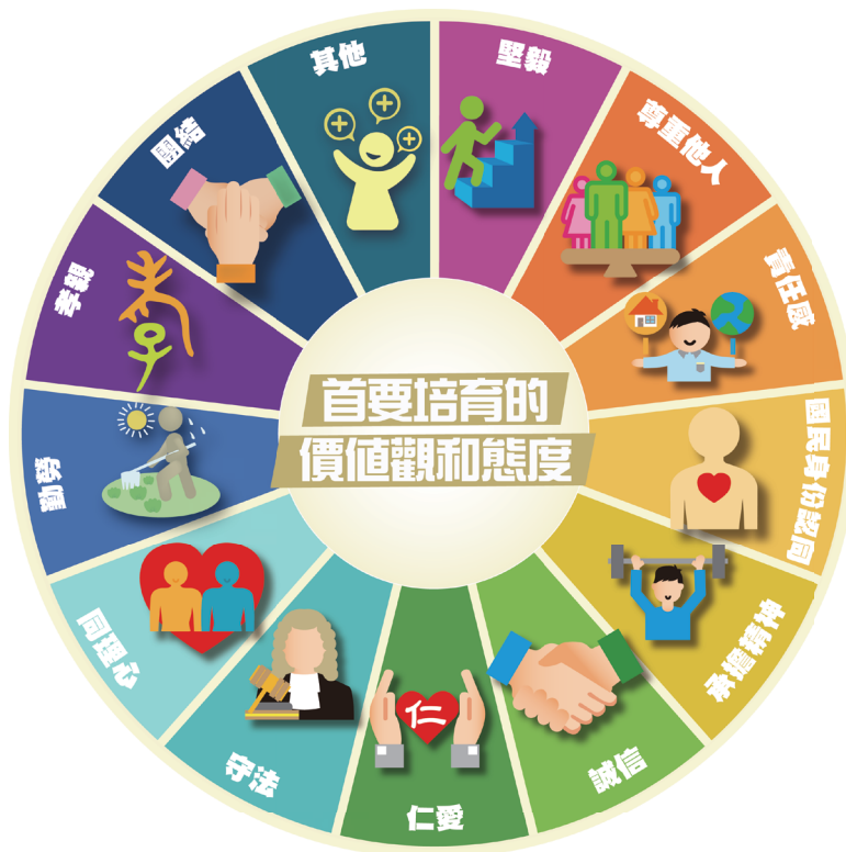
圖 1.4 十二個首要培育的價值觀和態度